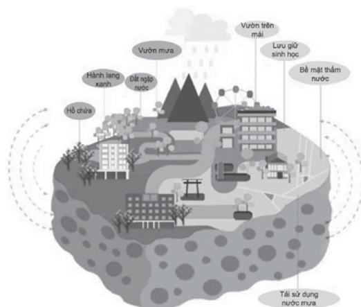
Hình 1. Minh họa về thành phố bọt biển [2]

Khác với cách tiếp cận “thoát nước nhanh” truyền thống, mô hình SPC ưu tiên sử dụng các quá trình tự nhiên như đất và thảm thực vật như một phần của chiến lược kiểm soát dòng chảy đô thị. Nguyên tắc “sáu trụ cột”, bao gồm: hấp thụ, lưu giữ tạm thời, lưu