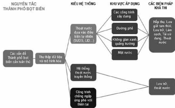
Hình 2. Nguyên tắc về Thành phố bọt biển [5]

trữ nước, làm sạch, tái sử dụng và xả nước ra hệ thống thoát nước tạo thành các hướng dẫn cho việc quản lý nước mưa đô thị [3] [4].