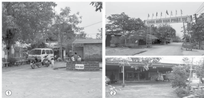
Hình 3. Giếng làng (1), Chùa (2), làng Quảng Phú Cầu

Không gian xưa chỉ còn giếng và ngôi chùa làng (xây tạm trên nền cũ) không có giá trị thẩm mỹ kiến trúc