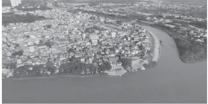
Hình 1. Làng Bát Tràng, bên bờ sông Hồng Hà

Làng nghề truyền thống của Hà Nội đã được hình thành và phát triển qua nhiều thế kỷ (khoảng 1000 năm). Hà Nội là nơi tập trung nhiều LNTT do hội tụ nhiều yếu tố thuận lợi, tinh hoa của các vùng miền trong cả nước. Trong lịch sử, Hà Nội là kinh đô của nhiều triều đại phong kiến Việt Nam, nơi tập trung của quyền lực chính trị, kinh tế, văn hoá, xã hội qua nhiều chế độ khác nhau, do vậy, các yếu tố nêu trên đã thúc đẩy sự phát triển của nhiều ngành nghề thủ công để phục vụ cho hoàng cung, giới quý tộc cũng như người dân các khu vực xung quanh.