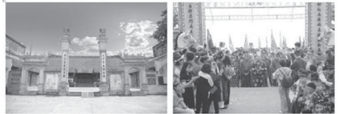
Đình làng Bát Tràng (không gian văn hóa vật thể)

Các công trình DSKT với những đặc điểm kiến trúc truyền thống độc đáo biểu hiện ở những tính chất: Tính truyền thống dân tộc đặc trưng; phong cách kiến trúc giản dị, khiêm tốn; vị trí địa hình kết hợp thiên nhiên; bố cục tương xứng, hài hòa; màu sắc trang trí đẹp mắt; khai thác sử dụng vật liệu địa phương. Cùng với không gian cảnh quan gắn liền, không gian sản xuất, kinh doanh buôn bán. Các công trình kiến trúc trong cấu trúc không gian LNTT chứa đựng những giá trị văn hóa - lịch sử, mang tính biểu hiện cao, thể hiện đầy đủ các tính chất đặc trưng của văn hóa làng nghề là: tính cộng đồng, tính tự trị, đời sống văn hóa, tôn giáo - tín ngưỡng (hình 4).