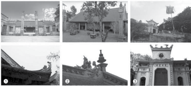
Hình 2. Đình làng (1), chùa làng (2), đền thờ mẫu (3) - Làng gốm sứ Bát Tràng

Các DSKT công cộng bao gồm: đình làng, chùa làng, đền thờ tổ nghề ... (đây là không gian trung tâm làng) của các LNTT Hà Nội, có niên đại hàng trăm năm, được người dân xây dựng, gìn giữ và bảo tồn qua nhiều thời kỳ thăng trầm của lịch sử. Các công trình DSKT công cộng thuộc 07 LNTT được khảo sát đều được trùng tu, sửa chữa, bảo tồn vào thời kỳ nhà Nguyễn, một số khác được sửa chữa, trùng tu trong giai đoạn xã hội mới hiện nay (chùa làng Vạn Phúc, đình làng Kim Lan,... hiện tại đang được trùng tu, sửa chữa). Phần lớn các loại hình DSKT công cộng các LNTT đều giữ được hình thái kiến trúc và cảnh quan kiến trúc truyền thống với các giá trị thẩm mỹ và văn hóa đặc trưng của người Việt như đình làng Vạn Phúc, Gốm Bát Tràng, Kim hoàn Định Công,... (hình 2)