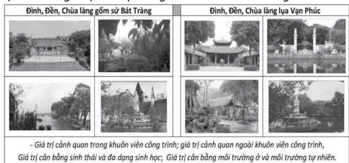
Hình 8. Giá trị cảnh quan và tạo lập môi trường sinh thái của di sản công trình công cộng các LNTT Hà Nội

Vị trí được lựa chọn thường hài hòa với cảnh quan xung quanh, hay nói một cách dân dã là “khu đất đẹp”. Tùy địa hình địa mạo của vị trí lựa chọn kết hợp với các hình thái tự nhiên, núi đồi, hồ ao, sông suối, tức là kiểu đất, thế đất để quyết định phương án xây cất các công trình kiến trúc. Với triết lý “tựa sơn, hướng thủy” các công trình di sản được người xưa lựa chọn đều có mặt tiền tòa chính hướng ra sông, ao, hồ. Đình, chùa, đền làng gồm Bát Tràng đều hướng ra sông Hồng, làng kim hoàn Định Công là sông Tô Lịch, làng lụa Vạn Phúc là sông Nhuệ. Phong cảnh tự nhiên tô điểm cho công trình kiến trúc, tạo nên các giá trị cảnh quan ngoài khuôn viên các công trình.