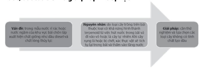
Hình 2. Ảnh hưởng của loại cây trồng chứa dầu terpenoid và giải pháp khắc phục

Việc quan trắc, theo dõi lượng thành phần, tính chất nước rỉ rác của bãi chôn lấp là một phần trong chương trình bảo trì hệ thống cây xanh trên mặt phủ của bãi. Trong giai đoạn này có thể xảy ra vấn đề