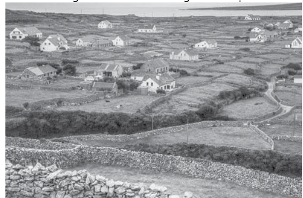
Hình 3. Nhà ở truyền thống tại vùng nông thôn Galway, Ireland 10

Các chính sách mới của Chính phủ Ireland về quy hoạch nhà ở tại các vùng nông thôn thúc đẩy định cư nông thôn bền vững như một thành phần quan trọng để mang lại sự phát triển cân bằng cho khu vực. Những ngôi nhà ở vùng nông thôn phải được xây dựng và thiết kế để hòa nhập tốt với môi trường xung quanh, bảo tồn môi trường sống tự nhiên và các di sản. Ngoài ra, chính sách còn quan tâm đến quy hoạch các điểm dân cư và hệ thống hạ tầng cho các điểm dân cư nông thôn trước ảnh hưởng của đô thị hóa.