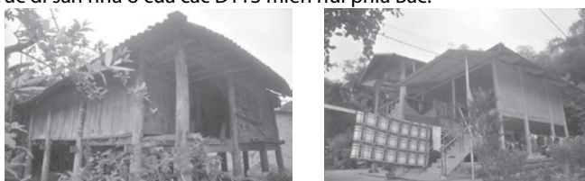
Hình 6. Nhà sàn truyền thống (trái) và nhà sàn xây dựng mới (phải)

Qua phân tích về thực trạng các hoạt động cải tạo, phát triển xây dựng mới nhà ở các DTTS tại vùng miền núi phía Bắc đã được khảo sát nêu trên cho thấy: 1) Về những mặt tích cực: Phù hợp với nhu cầu phát triển hộ gia đình và nhu cầu phát triển kinh tế - xã hội; đáp ứng chuyển dịch cơ cấu sản xuất kinh tế nông nghiệp và hiện đại hóa nông thôn; đáp ứng khả năng lắp đặt các trang thiết bị hiện đại sử dụng tiện nghi trong ngôi nhà ở; đáp ứng nhu cầu sinh hoạt và sử dụng tiện nghi của người dân; 2) Về những mặt tồn tại, hạn chế: Tăng thêm mật độ xây dựng trong không gian bản, làm biến đổi cấu trúc không gian bản, biến đổi cấu trúc không gian khuôn viên ngôi nhà, làm thay đổi hình thức và không gian nhà ở truyền thống; làm mất đi bản sắc giá trị văn hóa truyền thống, giá trị kiến trúc di sản nhà ở của các DTTS miền núi phía Bắc.