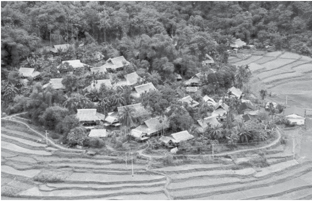
Hình 4. Bản truyền thống các dân tộc miền núi phía Bắc 11

Quá trình biến đổi của kiến trúc nhà ở truyền thống các dân tộc miền núi phía Bắc do nhiều yếu tố ảnh hưởng nhưng trong đó yếu tố chính vẫn là quá trình phát triển kinh tế, xã hội, văn hóa, đô thị hóa và công nghiệp hóa, hiện đại hóa nông thôn. Về biến đổi kiến trúc gồm: Biến đổi cấu trúc khuôn viên như xây dựng bổ sung mới thêm các không gian đáp ứng nhu cầu phát triển hộ gia đình, chuyển đổi chức năng các không gian trong khuôn viên đáp ứng nhu cầu hoạt động phát triển kinh tế hộ gia đình; biến đổi không gian nhà ở như cải tạo, mở rộng, phát triển thêm các không gian mới đáp ứng nhu cầu gia đình và nhu cầu phát triển kinh tế; biến đổi hình thức và vật liệu xây dựng như thay thế các loại vật liệu mới cho vật liệu truyền thống.