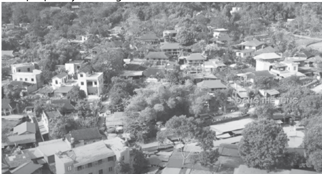
Hình 5. Bản, làng người Mường tỉnh Hòa Bình dưới tác động của đô thị hóa ngày nay

Quá trình biến đổi của kiến trúc nhà ở truyền thống các dân tộc miền núi phía Bắc do nhiều yếu tố ảnh hưởng nhưng trong đó yếu tố chính vẫn là quá trình phát triển kinh tế, xã hội, văn hóa, đô thị hóa và công nghiệp hóa, hiện đại hóa nông thôn. Về biến đổi kiến trúc gồm: Biến đổi cấu trúc khuôn viên như xây dựng bổ sung mới thêm các không gian đáp ứng nhu cầu phát triển hộ gia đình, chuyển đổi chức năng các không gian trong khuôn viên đáp ứng nhu cầu hoạt động phát triển kinh tế hộ gia đình; biến đổi không gian nhà ở như cải tạo, mở rộng, phát triển thêm các không gian mới đáp ứng nhu cầu gia đình và nhu cầu phát triển kinh tế; biến đổi hình thức và vật liệu xây dựng như thay thế các loại vật liệu mới cho vật liệu truyền thống.