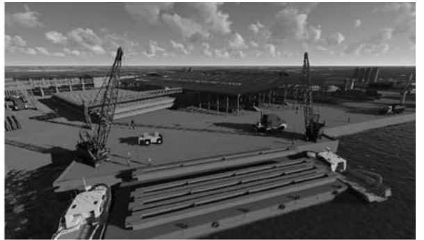
Hình 2. Mô phỏng quá trình chế tạo và vận chuyển dầm

Mô phỏng quá trình vận chuyển và lắp đặt dầm (Hình 2):