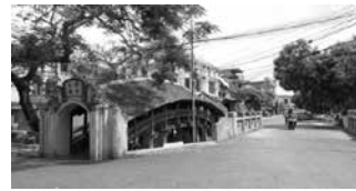
Cầu ngói chợ Lương, Nam Định