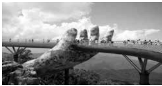
Cầu Vàng ở Đà Nẵng, Việt Nam