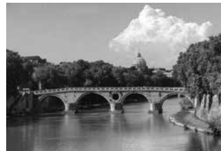
Cầu Pons Fabricius, Anh