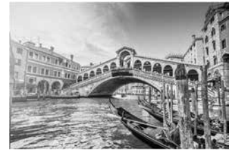
Cầu Rialto, Venice, Italy