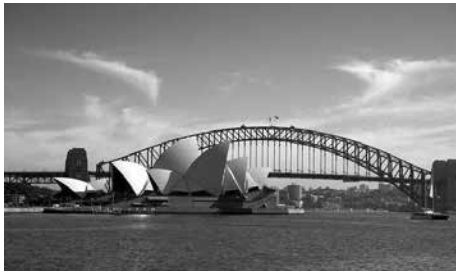
Cầu cảng Sydney, Australia