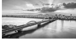
Cầu Rồng, Đà Nẵng