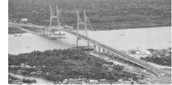
Cầu Mỹ Thuận, Vĩnh Long