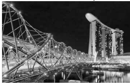
Cầu Helix, Singapore