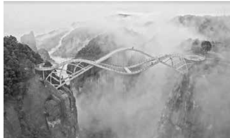
Cầu Ruyi, Trung Quốc