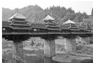
Cầu Chengyang, Trung Quốc