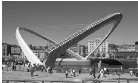
Cầu thiên niên kỷ Gateshead, Anh