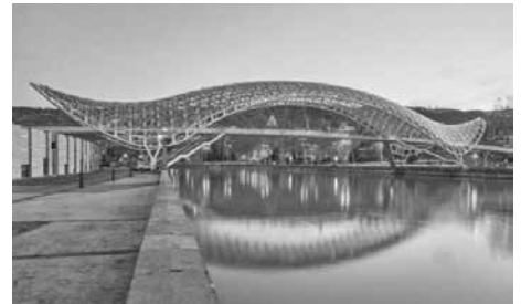
Cầu Peace, Tbilisi, Georgia