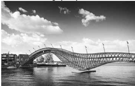
Cầu Python, Netherlands