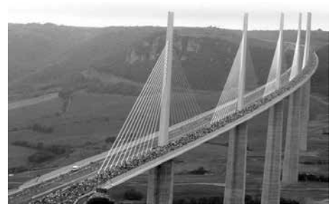
Cầu cạn Millau, Pháp