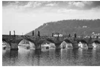
Cầu Charles, Cộng hòa Czech