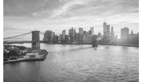
Cầu Brooklyn, Mỹ