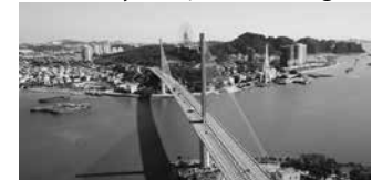
Cầu Bầy Cháy, Quảng Ninh