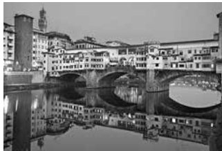
Cầu Ponte Vecchio, Italy