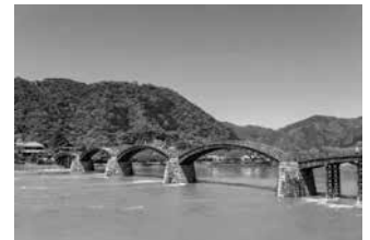
Cầu Kintai Kyo, Nhật Bản