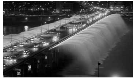
Cầu Banpo Girder, Hàn Quốc