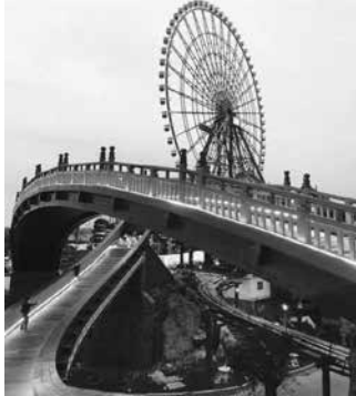
Cầu Koi, Hạ Long