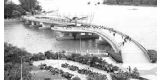
Cầu đi bộ Ninh Kiều, Cần Thơ