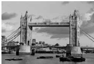
Cầu Tower, England