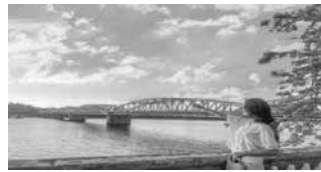
Cầu Trường Tiền, Huế