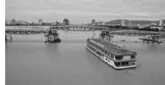
Cây Quay Sông Hàn, Đà Nẵng