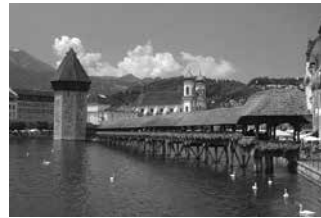
Cầu Chapel, Thụy Sĩ