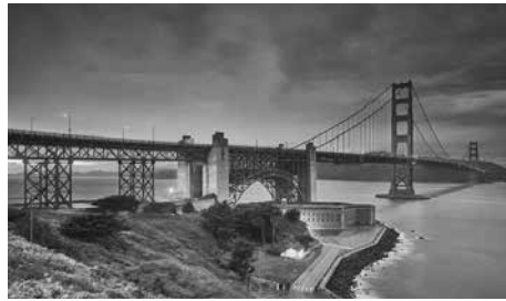
Cầu Golden Gate, Mỹ