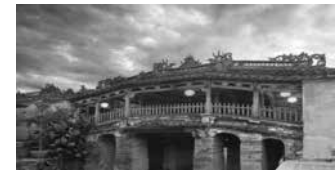
Chùa Cầu, Hội An