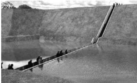
Cầu Moses, Halsteren, Hà Lan