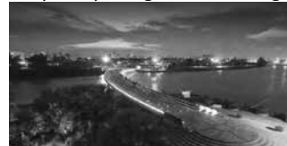
Cầu Ánh Sao, TP Hồ Chí Minh