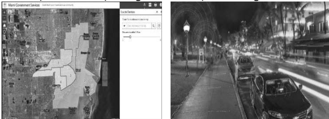
Hệ thống dữ liệu bản đồ (GIS) tại Miami – Florida, Hoa Kỳ

Trên cơ sở luật pháp hiện hành, cần áp dụng các biện pháp quản lý đô thị tương tự với các nước phát triển trên thế giới, trong đó có thể kể tới hệ thống luật, quy chuẩn, tiêu chuẩn và văn bản pháp lý, các cơ chế điều chỉnh thị trường thông qua các chính sách về thuế, phí. Ngoài các biện pháp kể trên, để Phú Quốc phát triển hiệu quả, bất động sản cần được kiểm soát đăng ký và lưu trữ hồ sơ chủ sở hữu, các quá trình mua bán, xây dựng và sửa chữa thông qua các bản đồ địa chính và hệ thống GIS rành mạch và công khai.