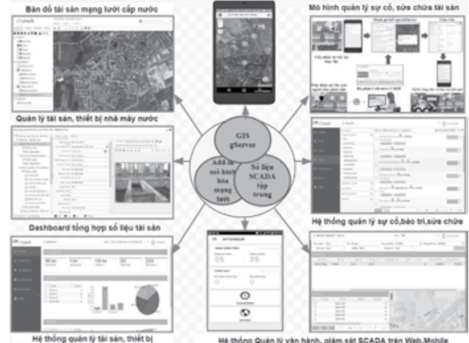
Hình 2.1. Tích hợp quản lý hoạt động nhà máy, mạng lưới, quản lý tài sản - phần mềm CityWork