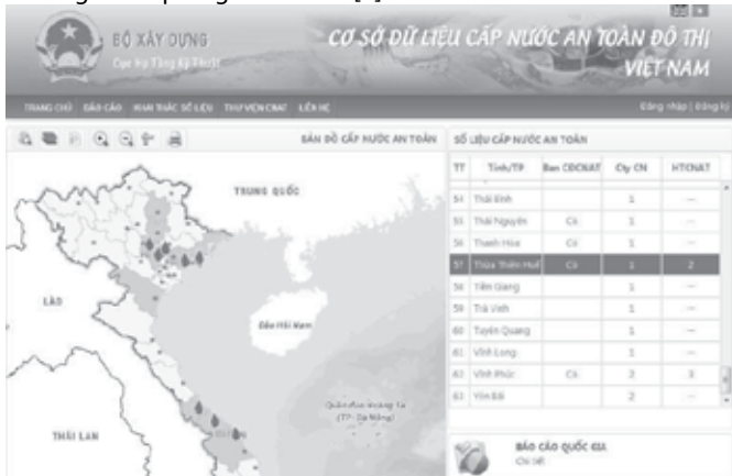
Hình 3.1. Trang Web cơ sở dữ liệu cấp nước an toàn đô thị Việt Nam [1]

Được sự hỗ trợ từ Tổ chức Y tế thế giới (WHO), trong năm 2015, Bộ Xây dựng triển khai xây dựng cơ sở dữ liệu (CSDL) cấp nước an toàn (CNAT) đô thị. Mục tiêu chính là thiết lập một công cụ hữu ích giúp cơ quan quản lý Nhà nước nắm bắt, đánh giá tình hình thực hiện Kế hoạch cấp nước an toàn (KHCNAT) tại các đơn vị cấp nước. Ngoài ra, CSDL về CNAT sẽ giúp Bộ Xây dựng theo dõi, đánh giá và quản lý hiệu quả hơn việc thực thi Thông tư 08/2012/TT-BXD Hướng dẫn thực hiện bảo đảm cấp nước an toàn và nhằm tiến tới chương trình quốc gia về CNAT [3].