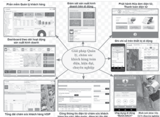
Hình 2.2. Mô hình quản lý, chăm sóc khách hàng, phần mềm CityWork

CityWork góp phần làm giảm tỷ lệ thất thoát nước từ việc phát hiện nhanh, xử lý kịp thời các sự cố trên mạng lưới cũng như phát hiện, xử lý nhanh các đồng hồ hỏng, không chính xác; Giảm chi phí sửa chữa, bảo trì tài sản mạng cấp nước từ việc quản lý chặt chẽ lịch lịch, lịch sử kiểm tra, lịch sử sửa chữa bảo trì thiết bị trên bản đồ mạng lưới; Giảm chi phí nhờ nâng cao hiệu suất sử dụng tài sản, tuổi thọ tài sản từ việc quản lý chặt chẽ quá trình vận hành và bảo trì tài sản mạng cấp nước; Góp phần nâng cao năng suất lao động từ việc quản lý chặt chẽ, cung cấp nhanh, kịp thời thông tin phục vụ kiểm tra, sửa chữa, bảo trì tài sản mạng cấp nước; Rút ngắn thời gian kiểm kê tài sản mạng cấp nước, lập kế hoạch bảo trì, sửa chữa định kỳ, hàng năm; Giảm thất thu từ việc phòng ngừa gian lận trong quá trình ghi chỉ số đồng hồ nước; Phòng ngừa sai sót trong quá trình tính toán và in hóa đơn tiền nước; Giảm tổng thời gian ghi chỉ số, tính toán, in hóa đơn tiền nước; Nâng cao chất lượng dịch vụ khách hàng từ việc xử lý kịp thời các sự cố, khiếu nại từ khách hàng.