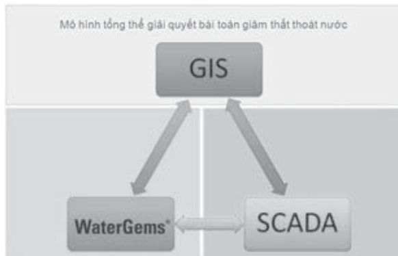
Hình 3.2. Tích hợp công nghệ GIS - SCADA - WaterGEMS nhằm phòng chống thất thoát, thất thu nước [4]

Các doanh nghiệp cấp nước đô thị đã và đang sử dụng các phần mềm bản đồ như AutoCAD, MicroStation, MapInfo hoặc ArcGIS để lập và quản lý bản đồ hiện trạng, quy hoạch hệ thống cấp nước. Các hệ thống GIS hoàn chỉnh hơn cả là hệ thống GIS được áp dụng tại Công ty TNHH MTV Cấp thoát nước Khánh Hòa (KHAWASSCO). Năm 2013, được sự hỗ trợ của Chính phủ Pháp, KHAWASSCO đã triển khai ứng dụng tích hợp công nghệ GIS - SCADA - WaterGEMS nhằm phòng chống thất thoát, thất thu nước và tối ưu hóa công tác quản lý mạng lưới cấp nước. Hệ thống bao gồm 3 mô đun: