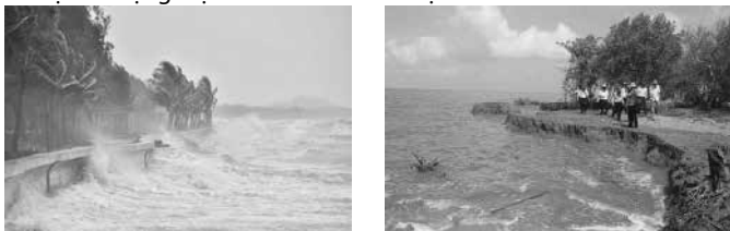
Hình 1 - Bão và sạt lở bờ biển ở Cà Mau

a. Vùng ven biển và hải đảo: Vùng ven biển và hải đảo của Việt Nam bao gồm: 3 khu vực Bắc bộ, Trung bộ và Nam bộ. Các khu vực này thường xuyên chịu nhiều tác động của các hiện tượng liên quan đến khí hậu như bão và áp thấp nhiệt đới (đặc biệt là vùng Trung bộ); lũ lụt và sạt lở đất (đặc biệt là vùng ven biển Bắc bộ và Trung bộ). Bên cạnh đó vùng ven biển là nơi tập trung của nhiều đô thị và các khu vực dịch vụ nên hầu hết các ngành và hoạt động kinh tế xã hội đã đang và sẽ chịu tác động mạnh của biến đổi khí hậu.