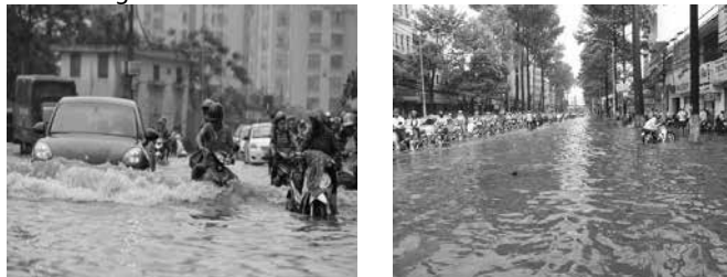
Hình 2: Ngập úng đô thị

- Ngập úng do lũ: Lũ trực tiếp từ các sông ở thượng lưu; lũ do xả nước từ các công trình hồ tưới tiêu, hồ thủy điện ở phía thượng nguồn và càng nguy hiểm hơn khi xảy ra đồng thời với mưa to và triều cường.