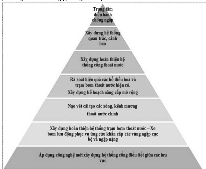
Hình 4 - Một số giải pháp giảm thiểu ngập úng đô thị [7]