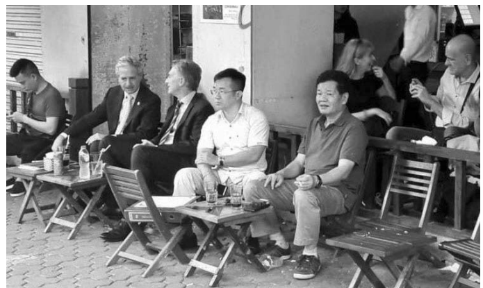
Hình 7. Tổng thống Argentina Mauricio Macri uống cà phê trên một con phố ở Hà Nội

Không gian sinh hoạt cộng đồng là một thành phần tích cực trong việc mang lại đời sống tinh thần theo xu hướng giao tiếp cộng đồng trong khu vực nội đô lịch sử Hà Nội. Trong không gian kiến trúc cảnh quan tuyến phố, không gian sinh hoạt cộng đồng là nơi mọi người có thể vừa sử dụng để nghỉ ngơi, tham gia các hoạt động chung như dịch vụ ăn uống, thể dục thể thao, vui chơi các trò chơi tập thể... Không gian này là yếu tố tạo nên sự hấp dẫn đối với khách du lịch trong và ngoài nước.