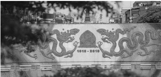
Hình 5. Tranh gốm trên đường đê Yên Phụ

Trong kiến trúc cảnh quan tuyến phố khu vực nội đô lịch sử Hà Nội, tác phẩm nghệ thuật tạo hình như: tranh, tượng, phù điêu, chữ viết,... thường được nghiên cứu bố trí kết hợp với các yếu tố kiến trúc, cây xanh, mặt nước nhằm đạt tới những mục tiêu văn hóa – tinh thần và hiệu quả thẩm mỹ, cảnh quan nhất định. Trong thực tế, các tác phẩm nghệ thuật tạo hình, trong đó chủ yếu là tranh, tượng hoành tráng... đã được đưa vào kiến trúc cảnh quan tuyến phố không chỉ là phương tiện trang trí và bố cục không gian có hiệu quả mà còn là một phương tiện gây tác động tinh thần, tình cảm thông qua các nội dung: ca ngợi cuộc sống, vẻ đẹp thiên nhiên, tuyên truyền bảo vệ môi trường, chống tệ nạn xã hội, an toàn giao thông,... Sự phong phú và đa dạng về hình thức và nội dung của nghệ thuật tạo hình thường đem lại hiệu quả trang trí cao trong bố cục không gian quảng trường, không gian mở khác, gây tác động truyền cảm nghệ thuật mạnh và qua đó có tác dụng giáo dục đạo đức và thẩm mỹ to lớn đối với cộng đồng.