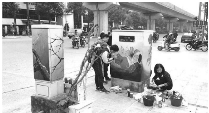
Hình 4. Cải tạo tủ điện bằng sơn thành tranh nghệ thuật

Các thiết bị kỹ thuật đô thị và kỹ thuật môi trường trong không gian kiến trúc cảnh quan tuyến phố khu vực nội đô lịch sử Hà Nội bao gồm: Thiết bị giao tiếp thị giác: biển báo, quảng cáo, ký tín hiệu (phục vụ giao thông, đi lại an toàn,...); Thiết bị chiếu sáng: chung toàn khu, toàn trục đường, cục bộ từng công trình, quảng trường, chiếu sáng quảng cáo, các loại cột đèn, tủ điện; Thiết bị môi trường: xô đựng giấy, thùng đựng rác, giá để xe... Các yếu tố kỹ thuật đô thị và môi trường ngày càng đóng vai trò quan trọng và càng ngày càng được quan tâm hơn trong thiết kế cảnh quan đô thị Hà Nội nói chung và cảnh quan tuyến phố nói riêng. Cùng với các yếu tố kiến trúc và thiên nhiên khác, các thiết bị kỹ thuật đô thị và môi trường đã được cải tiến, phát triển theo hướng hiện đại hóa, sử dụng năng lượng tự nhiên trên cơ sở những nguyên tắc tạo hình mỹ thuật công nghiệp.