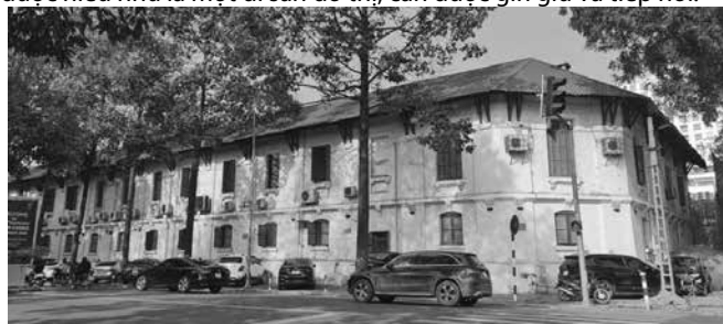
Hình 1. Công trình 61 Trần Phú (trước khi tháo dỡ)

Các công trình kiến trúc lớn không phải đối tượng mà thiết kế đô thị có thể can thiệp vào. Nhưng tầng cao, hình thức, màu sắc, vật liệu các công trình này có ảnh hưởng quyết định đến toàn bộ không gian tuyến phố. Đây cũng chính là vấn đề phức tạp của khu vực tuyến phố nội đô lịch sử Hà Nội, nó có tính chất giao thoa giữa việc lập quy hoạch, thiết kế công trình và thiết kế cải tạo chỉnh trang tuyến phố. Một số công trình có giá trị kiến trúc cảnh quan đặc biệt như nhà máy cũ, công trình công cộng cũ, biệt thự cũ gắn liền với lịch sử phát triển đô thị cũng tạo ra những dấu ấn cho đô thị có thể được hiểu như là một di sản đô thị, cần được gìn giữ và tiếp nối.