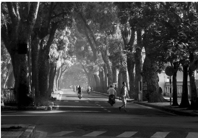
Hình 2. Hàng cây cổ thụ hai bên đường Hoàng Diệu

Cây xanh được sử dụng trong cảnh quan tuyến phố bao gồm cây bóng mát, cây bụi, thảm cỏ, khóm hoa,.... Hệ thống cây xanh các tuyến phố Hoàng Diệu, Trần Phú cũng tạo thành những đặc trưng đô thị Hà Nội. Sử dụng cây xanh đa dạng về hình khối và phong phú về màu sắc, cây xanh có thể được bố trí theo một trật tự hay quy luật nhất định nhưng cũng có thể được bố trí tự do. Trong quá trình sinh trưởng và phát triển, cây xanh biến đổi không ngừng và thường tạo nên những cảm giác linh động, kỳ ảo, thông qua sự thay đổi của chiều cao, vòm cây, tán lá, thân, cành, màu sắc, hoa quả,.... Cây xanh làm cho môi trường cảnh quan biến hóa theo thời gian và không gian. Do đó, ngoài tác động tích cực về môi trường, vi khí hậu và bảo vệ sức khỏe, cây xanh còn tạo nên những tác động thẩm mỹ hết sức phong phú.