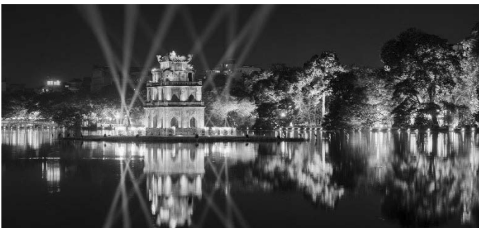
Hình 6. Chiếu sáng Hồ Gươm tạo ấn tượng cho khách du lịch