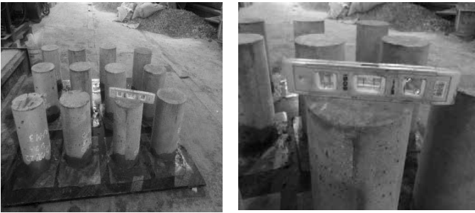
Hình 5. Làm capping cho phẳng bề mặt mẫu nén

Dán tem điện trở vào vùng đã đánh nhám bằng keo 502, đánh sạch lại sét ri ở điện cực (để phòng trừ trường hợp tem dán không ăn điện) rồi hàn điện cực vào tem điện trở với dây điện để kiểm tra trên thiết bị xem đã ổn định tín hiệu chưa. Trước khi tiến hành nén, kiểm tra lại bộ đếm trên máy xem đã hoạt động ổn định chưa. Khi gia tải, gia tải thật chậm để thu được nhiều số liệu nhất và số liệu ổn định nhất.