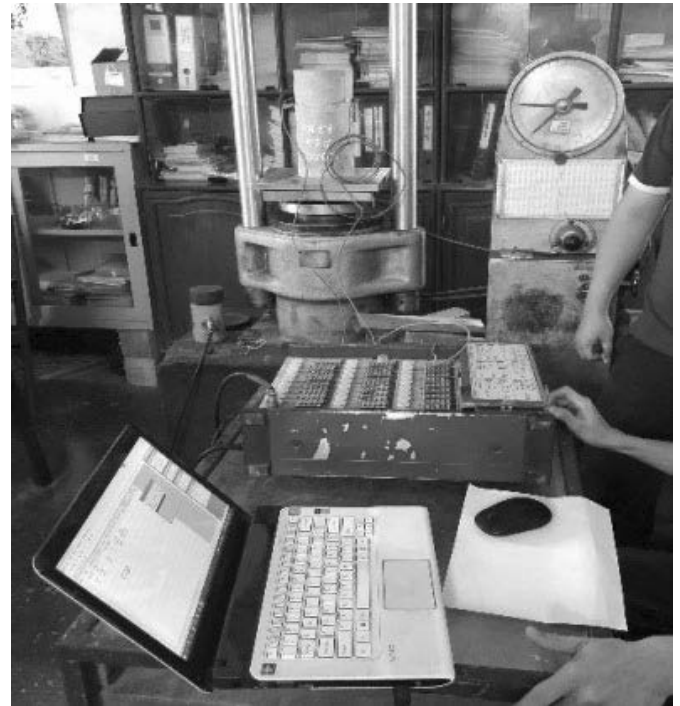
Hình 8. Nén mẫu