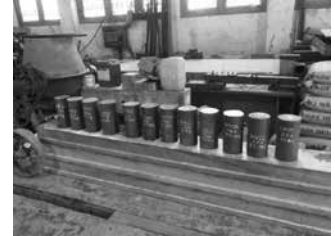
Hình 3. Lấy mẫu ra khỏi bể ngâm