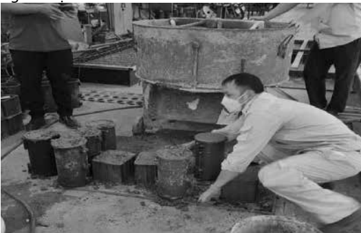
Hình 1. Chế tạo mẫu thử

Sau khi trộn hỗn hợp bê tông, tiến hành đổ ngay vào khuôn đúc mẫu. Đổ hỗn hợp bê tông theo từng phần khuôn (đầy nửa khuôn đối với khuôn lập phương và 1/3 khuôn đối với khuôn trụ) và đầm bằng tay, lưu ý gõ nhẹ xung quanh thành khuôn để tất cả bọt khí nổi hết lên trên, giúp cho bề mặt khối bê tông sau khi tháo khuôn không bị rỗ. Đổ nốt hỗn hợp theo các phần khuôn còn lại, lặp lại quá trình đầm tay và gõ thành đến khi đầy khuôn thì làm phẳng bề mặt mẫu.