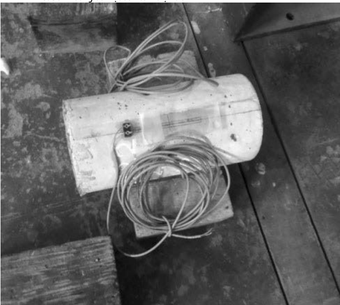
Hình 7. Dán tem và hàn điện cực