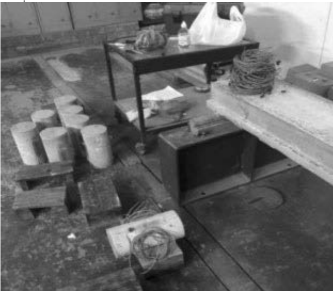
Hình 6. Đánh bóng bề mặt dán tem điện trở

Dán tem điện trở vào vùng đã đánh nhám bằng keo 502, đánh sạch lại sét ri ở điện cực (để phòng trừ trường hợp tem dán không ăn điện) rồi hàn điện cực vào tem điện trở với dây điện để kiểm tra trên thiết bị xem đã ổn định tín hiệu chưa. Trước khi tiến hành nén, kiểm tra lại bộ đếm trên máy xem đã hoạt động ổn định chưa. Khi gia tải, gia tải thật chậm để thu được nhiều số liệu nhất và số liệu ổn định nhất.