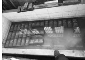
Hình 2. Bảo dưỡng mẫu

Ngay sau khi hoàn thiện bề mặt bê tông, tiến hành rải một lớp nilon mỏng lên trên để giữ được lượng nước trong giai đoạn đầu của quá trình thủy hoá. Tháo ván khuôn 2 ngày sau đúc mẫu rồi chuyển mẫu ngay vào trong bể ngâm để dưỡng ẩm bê tông chờ ngày thí nghiệm. Trước ngày thí nghiệm 2 hôm sẽ rời mẫu khỏi bể ngâm, để cho ráo nước.