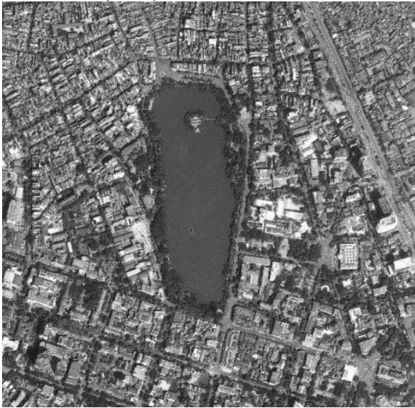
Hình 1. Hồ Gươm trên Google Map

Hồ Gươm nằm ở trung tâm Thủ đô Hà Nội, có diện tích 10,7 ha, được bao bọc bởi phố Đinh Tiên Hoàng ở phía đông và phía bắc, phố Lê Thái Tổ ở phía tây, và phố Hàng Khay ở phía nam. Đây cũng chính là không gian chuyển tiếp kết nối Khu 36 phố phường - còn được gọi là Khu phố cổ Hà Nội, vốn được hình thành từ rất lâu đời, ở phía bắc và Khu phố cũ (còn gọi là Khu phố Pháp) được hình thành từ cuối thế kỷ 19 ở phía nam (Hình 1, 2).