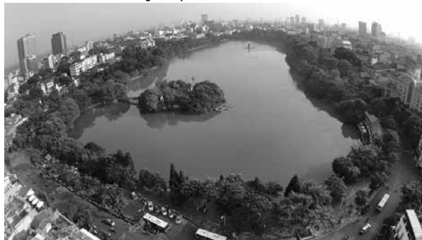
Hình 2. Toàn cảnh không gian Hồ Gươm