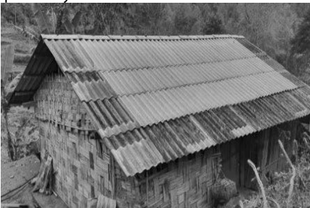
Hình 12. Mái nhà lợp bằng tấm fibro xi măng, xã Quang Trung, Hòa An, Cao Bằng - Tôn lợp

Tấm lợp fibro xi măng được sử dụng khá phổ biến dùng làm tấm lợp mái của nhà ở. Đây là loại vật liệu rẻ tiền, phù hợp với điều kiện kinh tế của đồng bào dân tộc. Tuy nhiên, tại nhiều khu vực địa hình khó khăn thì việc vận chuyển các tấm lợp fibro xi măng là một vấn đề cần phải lưu ý.