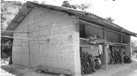
Hình 2. Nhà ở của đồng bào H'Mông tại huyện Đông Văn, Hà Giang

Kiểu nhà này có tường được đắp thủ công hoàn toàn bằng đất rồi lèn bằng phẳng, chắc chắn. Nhà trình tường ấm vào mùa đông và mát vào mùa hè. Vật liệu để làm những bức tường gồm đất sét, có độ dẻo dai nhất định để tạo sự kết dính lớn, trộn lẫn sỏi nhỏ để tạo độ cứng với mục đích chịu được các tác động từ bên ngoài.