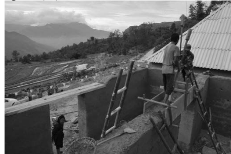
Hình 4. Trình tường nhà của đồng bào dân tộc Hà Nhì

Khuôn để trình tường làm gỗ dài chừng 2 - 2,5m, rộng 50 - 60cm, sâu 40 - 50cm được khóa chặt bởi những thanh gỗ ngang sau đó họ đổ đất vào khuôn rồi dùng chày giã cho chặt. Đất khai thác quanh nhà, chủ yếu là đất đỏ pha sỏi không được khô quá và cũng không được ướt quá. Nếu đất khô thì không có sự kết dính, còn đất ướt thì khi lên tường dễ bị xệ.