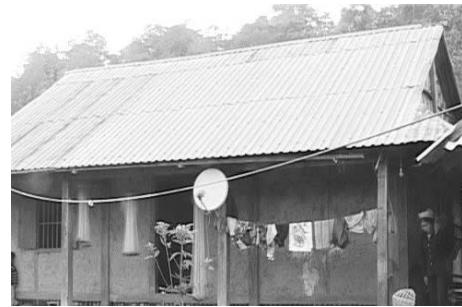
Hình 13. Mái nhà lợp bằng tôn