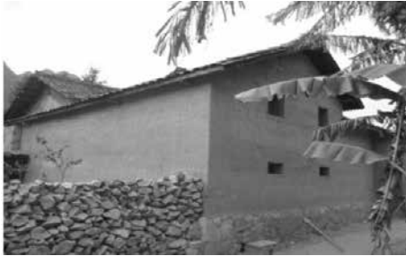
Hình 11. Sử dụng đá học làm móng nhà - Đất

Việc khai thác đá học để làm nhà không dễ dàng và phụ thuộc vào địa điểm có nguồn núi đá và phương tiện khai thác đá. Bên cạnh đó, sử dụng đá học trong xây dựng nhà còn bị phụ thuộc vào khoảng cách và phương tiện vận chuyển từ nơi khai thác đến nơi xây dựng nhà ở.