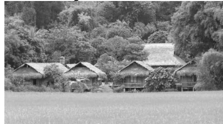
Hình 5. Nhà sàn của đồng bào Mường ở Mai Châu, Hoà Bình

Những ngôi nhà sàn truyền thống được coi là đặc trưng về nhà ở của đồng bào Mường. Nhà sàn Mường thường dựng bằng gỗ, những trụ cột, xà ngang thường là những loại gỗ tốt, không bị mục đến hàng trăm năm như gỗ lim xanh, mai, lái.