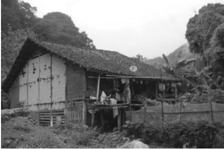
Hình 1. Nhà ở của đồng bào Tày ở huyện Quảng Yên, Cao Bằng

thường dành để nuôi, nhốt gia súc gia cầm và trữ nông cụ; tầng giữa là nơi ăn, ở, tiếp khách, sinh hoạt chính của chủ nhà; tầng trên (gác xếp) là nơi trữ và bảo quản lương thực. Tuy nhiên, hiện nay, đồng bào Tày-Nùng không nuôi, nhốt gia súc, gia cầm ở gác sàn nữa mà dùng nơi này làm không gian sinh hoạt chung và để các vật dụng cần thiết.