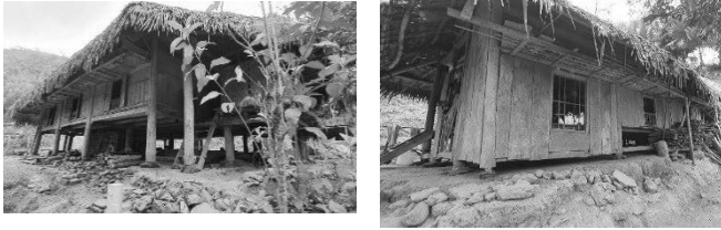
Hình 6. Nhà ở của đồng bào dân tộc Tày xã Tân Minh, Đà Bắc, Hòa Bình

vẫn còn nhiều hộ nghèo, hộ cận nghèo. Nhà ở của đồng bào DTTS & MNPB tại các khu vực này chủ yếu là nhà tạm bợ, dột nát, thiếu kiên cố, kết cấu bằng gỗ, tre lũa không bền chắc ... nên có kết cấu không ổn định và gặp rất nhiều nguy cơ khi gặp các điều kiện thời tiết cực đoan (mưa lũ, gió lốc, mưa đá...) xảy ra. Trên Hình 6 trình bày minh họa hình ảnh nhà ở được khảo sát tại một số địa điểm thuộc miền núi phía Bắc.