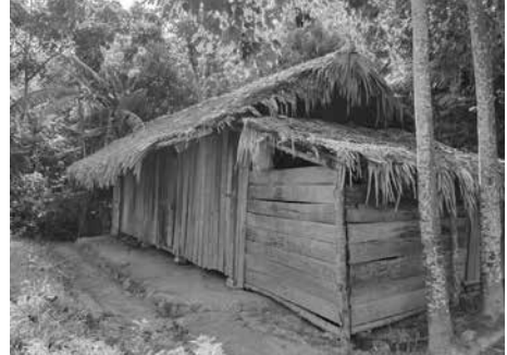
Hình 9. Nhà ở của đồng bào dân tộc Tày xã Tân Minh, Đà Bắc, Hòa Bình

Đây là vật liệu chính được sử dụng trong xây dựng nhà ở. Gỗ thường được sử dụng dưới dạng cây gỗ để làm cột, kèo, xà nhà