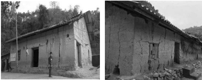
Hình 7. Nhà ở của đồng bào dân tộc H'Mông xã Tà Tổng, Mường Tè, Lai Châu