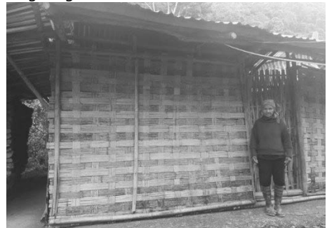
Hình 10. Nhà vách nứa (liếp) của dân tộc La Hủ xã Nậm Khao, Mường Tè, Lai Châu

Đây là các loại vật liệu sử dụng trong xây dựng nhà ở rất phổ biến ở vùng núi phía Bắc. Các loại vật liệu này được bà con dân tộc khai thác trong rừng.