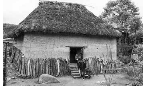
Hình 3. Nhà ở của đồng bào Hà Nhì tại huyện Mường Tè, Lai Châu

Dân tộc Hà Nhì ở Việt Nam có khoảng trên 25.000 người, cư trú tại Lào Cai, Lai Châu và Điện Biên. Nhà của người Hà Nhì đen ở Lào Cai chủ yếu là nhà trình tường, nhà dựa lưng vào núi, mặt hướng ra phía thung lũng. Mùa làm nhà thường tập trung vào những tháng cuối năm sau khi gặt hái xong, cũng là khi mùa mưa đã chấm dứt.