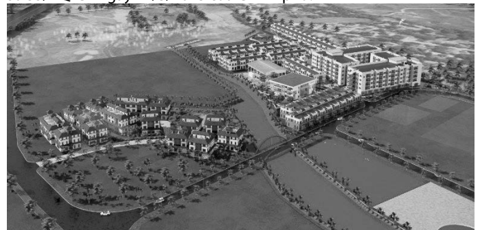
Hình 1. Dự án khu nhà ở công nhân và dịch vụ công nghiệp, xã Quang Tiến, Hoà Bình

Ở góc độ tài chính trước mắt, tập trung phối hợp với Ngân hàng Nhà nước Việt Nam triển khai thực hiện Chương trình tín dụng khoảng 120.000 tỷ đồng và các gói tín dụng cụ thể để cho chủ đầu tư và người mua nhà của các dự án NOXH, nhà ở công nhân vay với lãi suất thấp hơn khoảng từ 1,5 - 2% so với lãi suất cho vay trung dài hạn VND bình quân của các ngân hàng thương mại nhà nước (bao gồm Agribank, BIDV, Vietcombank, Vietinbank) trên thị trường trong từng thời kỳ và các ngân hàng thương mại ngoài nhà nước có đủ điều kiện với từng gói tín dụng cụ thể theo chỉ đạo tại Nghị quyết số 33/NQ-CP ngày 11/3/2023 của Chính phủ.