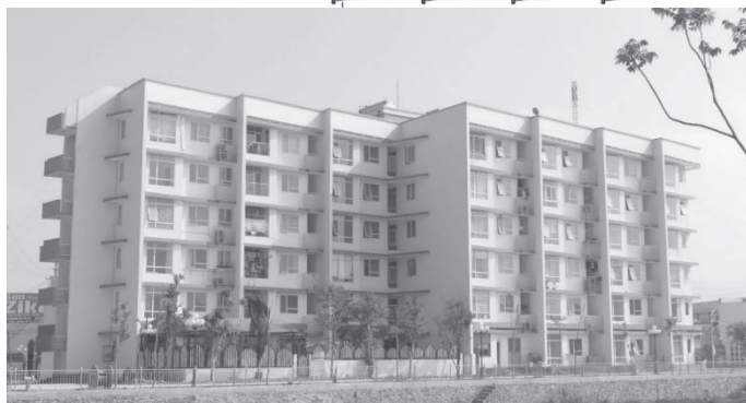
Hình 2. Công trình nhà ở công nhân, TP Hoà Bình