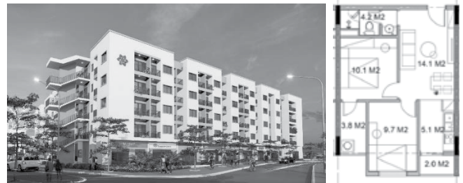
Hình 3. Phương án nhà ở công nhân, khu công nghiệp xã Quang Tiến, TP Hoà Bình