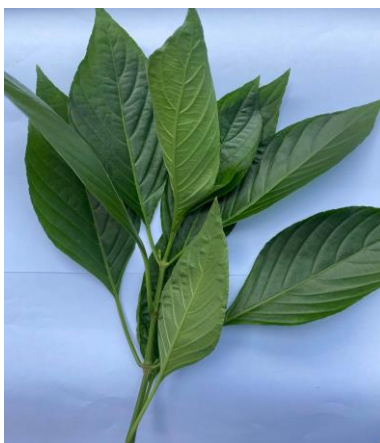
Hình 1. Cây lá cẩm

Cây lá cẩm ( Peristrophe bivalvis L. Merr.) được trồng tại thị xã Bình Long, tỉnh Bình Phước, được vận chuyển đến trung tâm thí nghiệm của Trường Đại học Thủ Dầu Một và rửa sạch để loại bỏ bụi, lá vàng và sâu bệnh (hình 1).