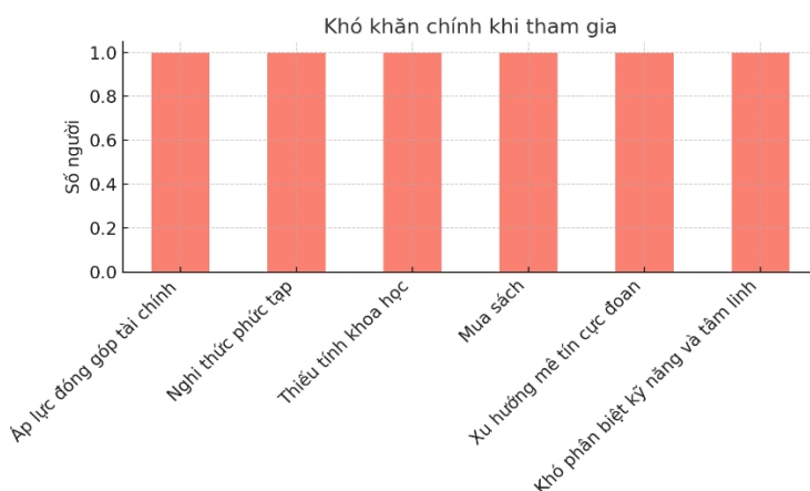
Biểu đồ 2. Khó khăn chính khi tham gia hiện tượng tôn giáo mới tại TP.HCM

Tuy vậy, người tham gia cũng đối diện với những khó khăn nhất định như áp lực đóng góp tài chính, nghi thức mới mẻ, nội dung thiếu cơ sở khoa học hoặc có xu hướng mê tín cực đoan. Một số cá nhân nhận thấy sự mập mờ giữa yếu tố kỹ năng và tâm linh. Phản ứng của gia đình khá đa dạng, từ ủng hộ, trung lập đến phản đối, đặc biệt khi lo ngại vấn đề tài chính và niềm tin cực đoan. Về dự định tương lai, đa số vẫn tiếp tục duy trì kết nối, song có xu hướng chọn lọc hoạt động để giảm thiểu rủi ro, cho thấy sự cân nhắc giữa lợi ích cá nhân và các yếu tố tiềm ẩn nguy cơ.