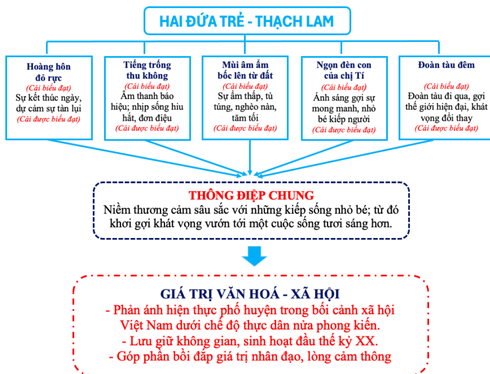
Hình 3. Sơ đồ hoá hệ thống kí hiệu trong văn bản “Hai đứa trẻ”

Sau khi học sinh đã hoàn thành các bước phân tích và giải mã, giáo viên có thể tổng hợp, khái quát các kí hiệu và mối quan hệ của chúng với thông điệp, ý nghĩa văn hóa - xã hội của tác phẩm bằng sơ đồ trực quan. Cách trình bày này giúp học sinh có cái nhìn tổng thể, dễ tiếp cận hệ thống kí hiệu trong Hai đứa trẻ, đồng thời nhận thức rõ hơn giá trị nghệ thuật và nhân văn mà Thạch Lam gửi gắm trong tác phẩm.