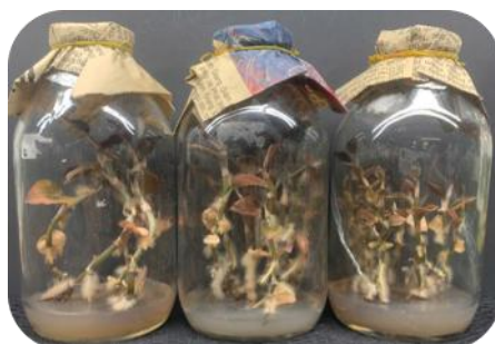
Hình 1. Cây lan kim tuyến ( Anoectochilus sp.) in vitro

Những bình mẫu lan kim tuyến ( Anoectochilus sp.) được cung cấp bởi phòng thí nghiệm nuôi cấy mô thực vật, Trường Đại học Thủ Dầu Một (Hình 1). Sau khi thu nhận, mẫu được xử lý bằng kéo và dao phẫu thuật thành các đoạn dài 2 cm trong tủ cấy vô trùng. Các đốt lan kim tuyến đều mang hai đốt có mắt ngủ của chồi.