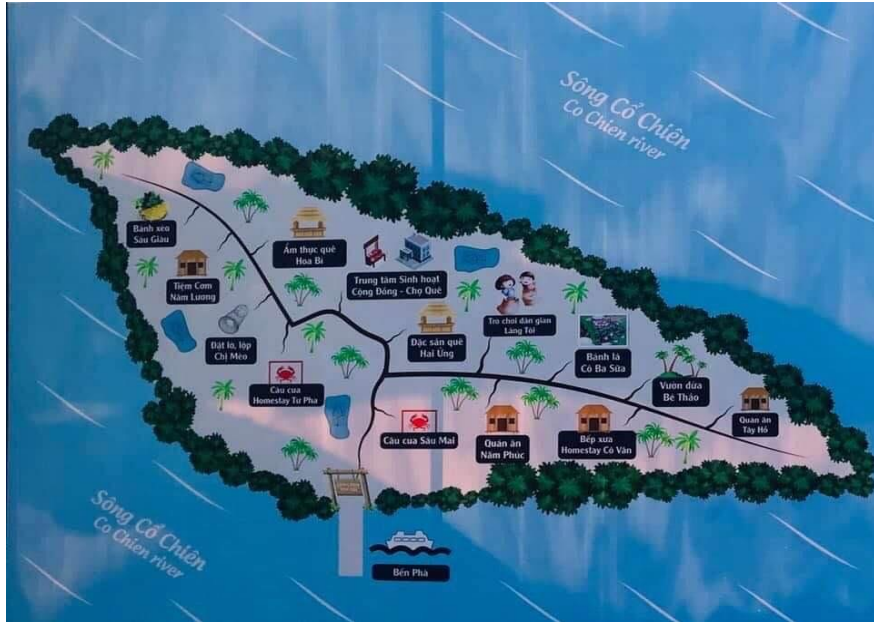
Hình 2. Các dịch vụ du lịch cung ứng tại Côn Chim được công ty du lịch thiết kế Nguồn: khảo sát thực địa (2020, 2021)

Khi nhận thấy được tiềm năng phát triển du lịch gắn với nông nghiệp của địa phương, đại diện Sở Văn hoá Thể thao Du lịch (VHTTDL) Trà Vinh đã đề xuất nên tận dụng ưu thế để phát triển du lịch. Tiếp theo là quá trình trao đổi giữa chính quyền địa phương và các hộ dân cũng như là doanh nghiệp vận hành hoạt động du lịch và các chuyên gia phát triển du lịch để tìm ra một mô hình tốt nhất tận dụng lợi thế của địa phương và đặc ứng nhu cầu của thị trường. Sự trao đổi hợp tác hết diễn ra xuyên suốt, thường xuyên trong giai đoạn khởi sự, bằng cách trò chuyện thân mật giải quyết vấn đề nhanh chóng như những người thân trong gia đình dẫn đến sự thỏa thuận kêu gọi các bên liên quan (phỏng vấn sâu, 2020, 2021, 2022).