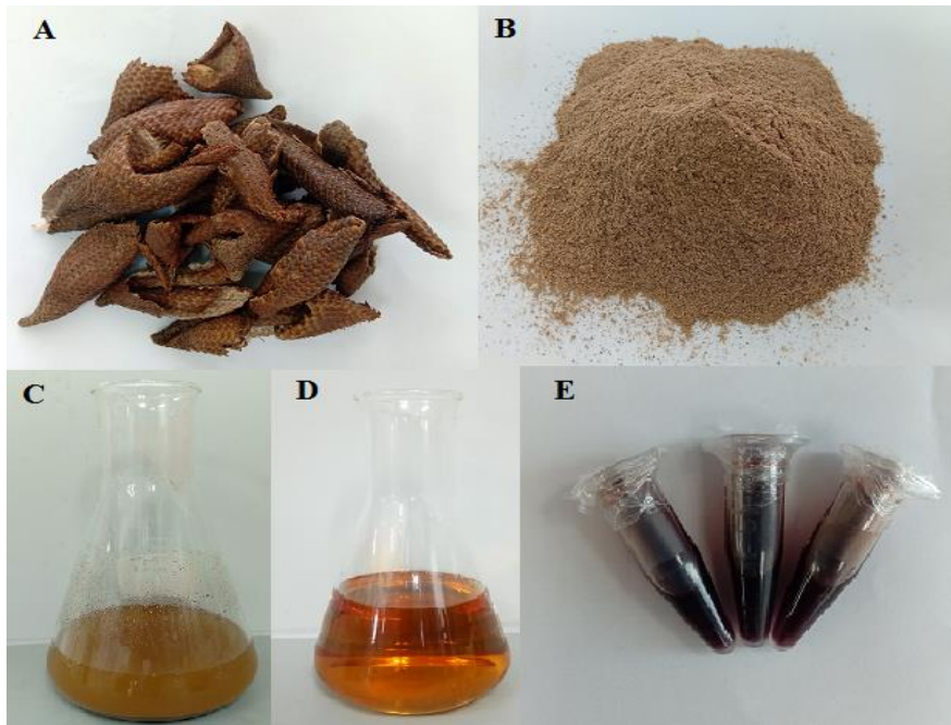
Hình 1. Kết quả xử lý mẫu và tách chiết vỏ mây Thái (A). Vỏ mây Thái đã sấy khô; (B). Bột vỏ mây Thái; (C). Bột vỏ mây Thái được ngâm chiết trong EtOH 90%; (D). Dịch chiết đã lọc sau 7 ngày ngâm chiết; (E). Cao chiết nồng độ 200 mg/mL trong EtOH

trong quá trình được thể hiện (Hình 1). Việc sử dụng EtOH làm dung môi tách chiết được chứng minh có phổ tách chiết rộng và an toàn hơn so với một số dung môi khác như methanol, ethyl acetate,...(Martin và nnk., 2014), EtOH nồng độ cao với tỷ lệ nước thấp do đó góp phần rút ngắn thời gian trong quá trình cô quay đũa dung môi để thu cao đặc (Ngân và nnk., 2018). Kết quả hiệu suất thu hồi cao thô EtOH được tính dựa trên khối lượng ban đầu của bột mây Thái sử dụng tách chiết, sau 3 lần tách chiết cho hiệu suất trung bình đạt 6.72 \pm 0.23 (%) (Bảng 1).