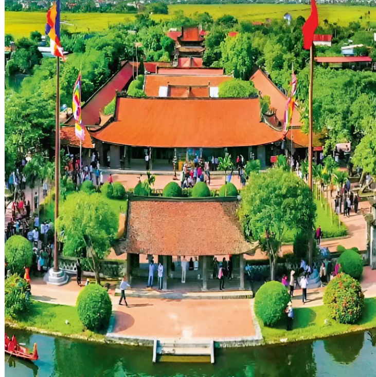
Chùa Keo

người Việt. Trong lễ hội làng Keo, nhân dân còn có một tục lệ dân gian thể hiện niềm tin tín ngưỡng tôn giáo sâu sắc là “chui qua kiệu Bà Keo” và “cướp lộc thờng thắng kiệu Bà Keo”. Bởi từ xưa đến nay, họ vẫn truyền tai nhau rằng nếu chui qua kiệu Bà Keo hoặc cướp được một đoạn thờng thắng kiệu Bà Keo mang về thờ sẽ được may mắn cả năm. Sau 3 ngày hội, ngày mùng 8/4 dân làng sẽ thực hiện thủ tục dải và rước áo trầu về lại nghề Keo.