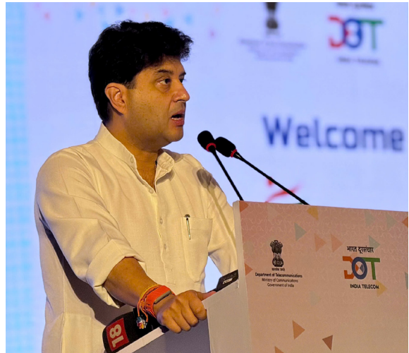
Ông Shri Jyotiraditya M. Scindia Bộ trưởng Bộ Thông tin và Phát triển khu vực Đông Bắc Ấn Độ.

Tham dự Bharat Telecom 2025, Halotimes là đại diện duy nhất trong lĩnh vực truyền thông - văn hóa của Việt Nam, thể hiện vai trò tiên phong của doanh nghiệp Việt trong hệ sinh thái đổi mới sáng tạo toàn cầu. Sự kiện đã tạo ra cơ hội kết nối B2B sâu rộng với các nhà cung cấp viễn thông và giải pháp phần mềm từ Ấn Độ - quốc gia được đánh giá là trung tâm công nghệ viễn thông hàng đầu thế giới.