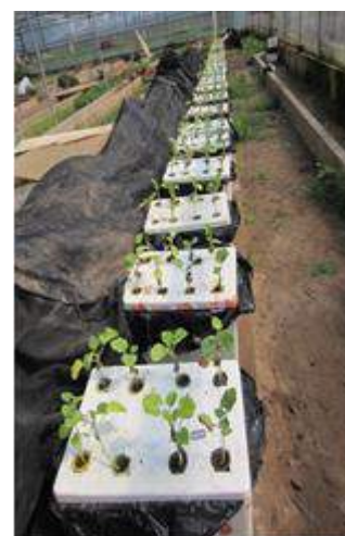
Hình 1. Thí nghiệm trồng bầu trong dung dịch thủy canh