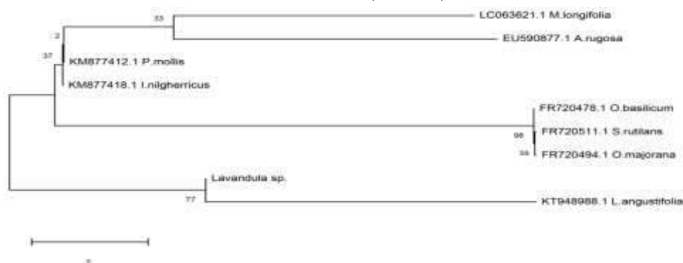
Hình 2. Cây phả hệ được xây dựng từ trình tự gen rpoB kết hợp với tập hợp các trình tự RpoB đã công bố của các loài thuộc họ Hoa môi ( Lamiaceae ). Sử dụng phần mềm MEGA 5.2 (12), với các tham biến: thuật toán Maximum Likelihood, mô hình Tamura-Nei model (JTT), phương pháp Bootstrap với 1000 lần lặp lại.

Tỷ lệ sống phụ thuộc vào nhiều yếu tố như nhiệt độ, độ ẩm, giá thể... của điều kiện rèn luyện. Tỷ lệ sống của cây oải hương cấy mô đã được công bố rất khác nhau từ 50-55% [12] hoặc 87% [3]. Trong nghiên cứu này, 3 loại giá thể gồm: đất, đất + xơ dừa (1:1), đất + trấu (1:1) tỷ lệ sống lần lượt là: 12,0; 65,0 và 26,0 (%). Như vậy, giá thể đất + trấu (1:1) là phù hợp để rèn luyện cây oải hương cấy mô, tỷ lệ sống đạt 65%, cây sinh trưởng khá tốt (Hình 3e).