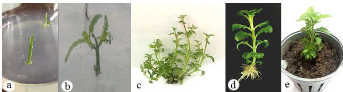
Hình 3. Các bước nhân nhanh cây oải hương lá xẻ bằng nuôi cấy mô. a, b. Đốt thân oải hương ở thời điểm mới khử trùng bề mặt và sau nuôi cấy 3 tuần. c. Cụm chồi oải hương in vitro trên môi trường bổ sung BAP 0,7 \text{ g.L}^{-1} sau 8 tuần nuôi cấy. d. cây in vitro hoàn chỉnh trên môi trường bổ sung NAA 0,5 \text{ mg.L}^{-1} . e. Cây oải hương trên giá thể đất + xơ dừa (1:1) sau 3 tuần được rèn luyện