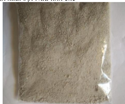
Hình 4. Bột Nưa thành phẩm