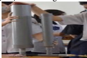
Hình 3. Mô hình của nhóm 1

Thiếu nam - Tên nhóm do học sinh lớp 10A11 đặt (Hình 4): “Mình làm vậy để cho lượng nước cân bằng với nhau để giảm ngập lụt ở những nơi có vị trí thấp.” Nhóm còn đề xuất lắp đặt thêm bộ phận lọc rác ở ống thứ hai.