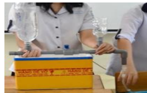
Hình 4. Mô hình của nhóm Thiếu nam

Nhìn chung, HS vận dụng được kiến thức trong bài học và hiểu được các khái niệm, đặc điểm của phát triển bền vững để đề xuất các ý tưởng phát triển bền vững trong mô hình đập thủy điện. Kết quả nghiên cứu bước đầu cho thấy việc tích hợp phát triển bền vững trong chủ đề Đập thủy điện phát triển bền vững có hiệu quả trong việc dạy học môn Vật lí mạch nội dung về năng lượng, đồng thời bồi dưỡng nhận thức về phát triển bền vững của HS.