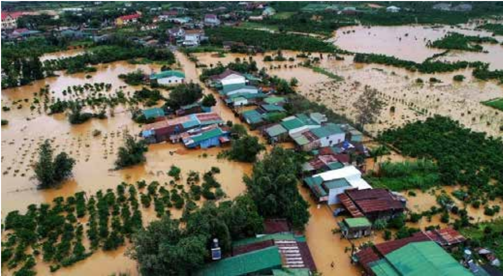
▲ Xây dựng kịch bản BDKH là nền tảng khoa học then chốt để đánh giá tác động của BDKH

môi trường (của các vấn đề môi trường như suy thoái, ô nhiễm...) đến sự ổn định chính trị (có từ ổn định về an ninh xã hội và ổn định kinh tế) [3]. Để xác định và đánh giá được tác động của môi trường tới ổn định kinh tế - xã hội (nghĩa là có thể phân tích và hình thành chính sách tâm quốc gia), một bộ chỉ số của tác động môi trường - chỉ số ANMT - được cho là cần thiết. Phương pháp kịch bản theo cách tiếp cận dự báo dài hạn (foresight) được cho là thích hợp cho việc xây dựng bộ chỉ số ANMT này. Lựa chọn phương pháp xây dựng kịch bản theo cách tiếp cận dự báo dài hạn (foresight) giúp cung cấp thông tin cho các nhà quản lý và hoạch định chính sách trong việc nhận diện các mối nguy cơ đe dọa ANMT Việt Nam để xây dựng chính sách, pháp luật phù hợp bảo đảm ANMT trong tổng thể an ninh quốc gia.