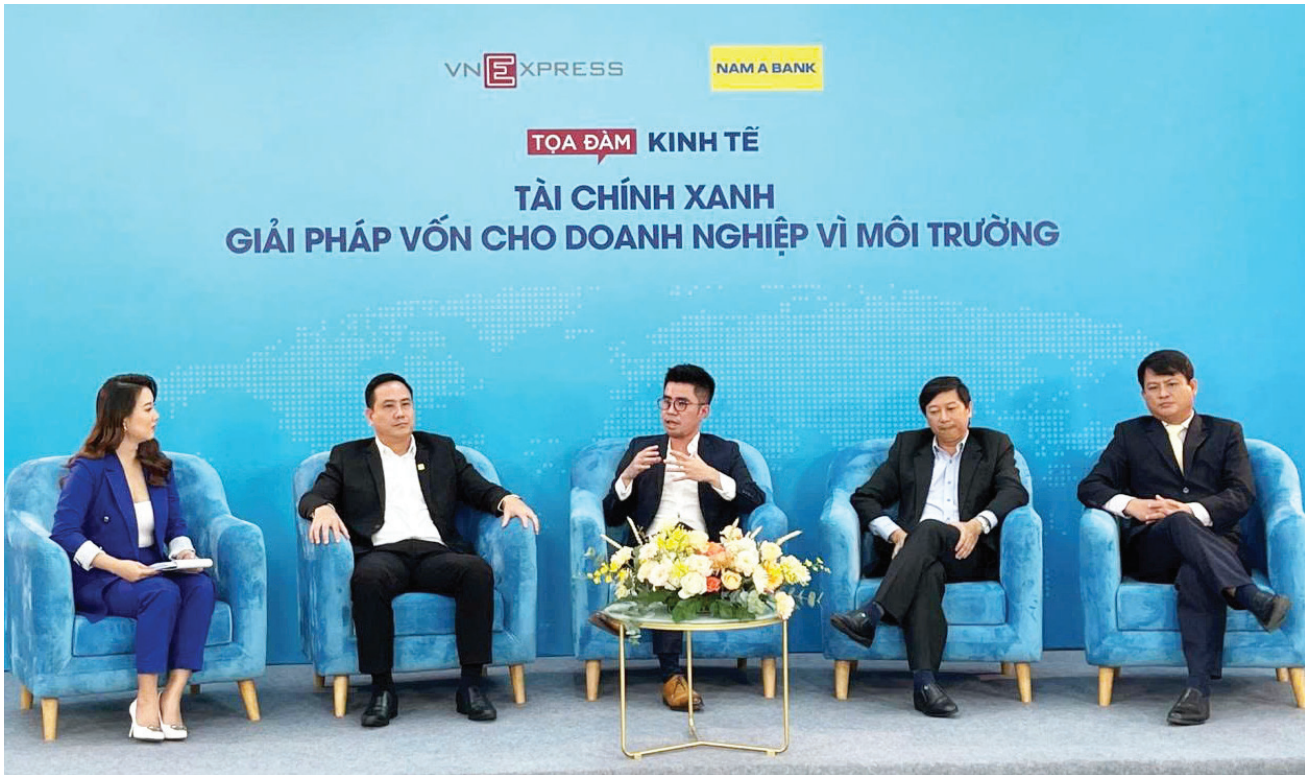
Toạ đàm kinh tế TCX - Giải pháp vốn cho DN vì môi trường

ra, chính sách hỗ trợ phát triển TDX giai đoạn vừa qua cũng chưa giải quyết được bài toán về nguồn vốn ngân hàng thực hiện TDX. Việc đầu tư vào các ngành/lĩnh vực xanh chủ yếu là nguồn vốn trung và dài hạn, thời gian hoàn vốn lâu, trong khi nguồn vốn huy động của các TCTD phần lớn là ngắn hạn.