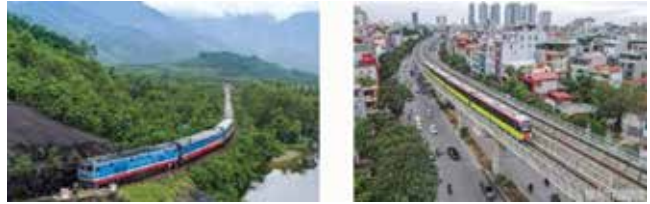
▲ Hình 3. Tối ưu hóa hoạt động của các chuyến tàu

Để tối ưu các hoạt động, cần thiết kế chương trình quản lý tối ưu cho từng tuyến đường sắt bao gồm lập biểu thời gian biểu của hành trình, xác định tốc độ tối ưu và phát hiện những trở ngại, những yếu tố bất lợi trong quá trình chuyển động của tàu. Hỗ trợ cho công việc này có thể sử dụng phần mềm “kiểm soát hoạt động” đối với hoạt động vận tải đường sắt của Việt Nam. Phát triển và duy trì được giải pháp này sẽ giúp tàu được vận hành một cách thuận lợi hơn, tránh được những thời điểm tốc tốc, giảm tốc hoặc dừng lại không cần thiết, khắc phục được những bất lợi ở khu vực có địa hình không thuận lợi (điểm cao đột ngột, điểm thấp giữa đường).