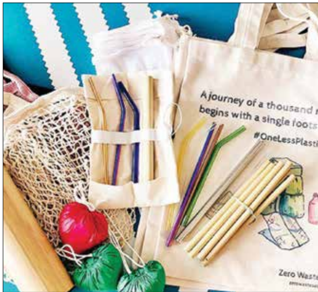
▲ Người tiêu dùng sử dụng sản phẩm xanh góp phần mở ra thị trường tiềm năng sản xuất xanh