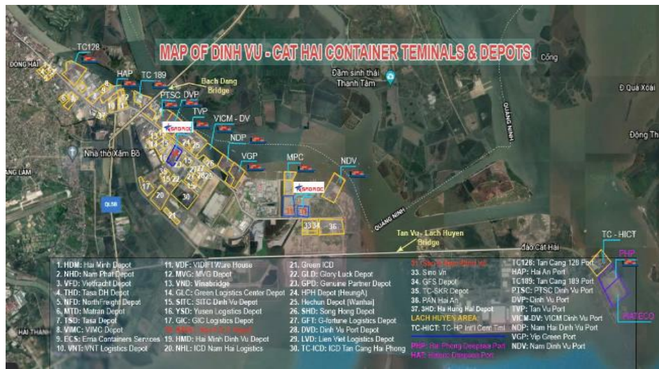
Hình 1. Các container depot tại khu vực Hải Phòng

của các tiêu chí được đề xuất, và các phương án lựa chọn. Mặc dù vậy, kết quả thường mang tính chủ quan, ý kiến cá nhân của người được khảo sát hay nhà ra quyết định. Một trong những phương pháp điển hình và khá phổ biến để xử lý và giải quyết các bài toán, vấn đề có tính chất không rõ ràng, không xác định cụ thể và số liệu phức tạp là phương pháp lý thuyết tập mờ Fuzzy. Chính vì vậy, những nghiên cứu gần đây đã phối hợp nhiều phương pháp với nhau để tăng tính chính xác cũng như sự khách quan trong việc đánh giá lựa chọn. Trong nghiên cứu này, phương pháp phân tích thứ bậc mờ Fuzzy AHP (Fuzzy Analytic Hierarchy Process) được sử dụng chung với phương pháp Fuzzy TOPSIS (Technique for Order Preference by Similarity to Ideal Solution) để tìm ra được thứ tự xếp hạng các công ty cung cấp phần mềm, giải pháp chuyển đổi số cho cảng biển, kho bãi và depot, đặc biệt tập trung cho hoạt động quản lý giám định tại container depot.